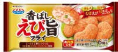
香ばしえび旨フライ