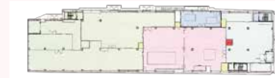
各フロアで清浄度区分ごとに床色を変えています。(※色はイメージ)

コンタミの防止と、クリーンレベルの保持を徹底するために、工場内の清浄度区分を細分化し、従業員の動線にも制約、配慮しています。また、隣接する清浄区分の異なる部屋間の気流についても、各室の給気量と排気量を調節することによって各室の気圧を管理しています。