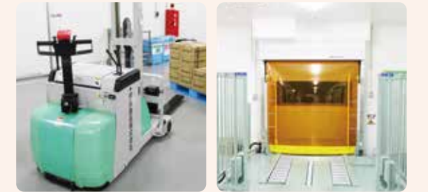
従業員の負担軽減のために導入された設備類

「フードディフェンス」が重要視される中、キョクヨーでは、「コミュニケーションこそ最大のフードディフェンスである」と考えており、今後も従業員の長所や創造性を尊重し、活気ある職場環境の構築に努めます。