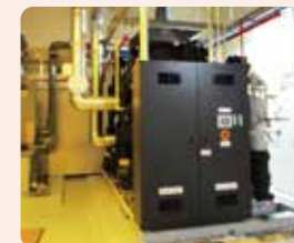
新設されたノンフロン冷凍機

新設した冷凍機には、オゾン層を破壊しないアンモニアでCO 2 を冷却する「間接冷却方式」の新鋭機を採用しました。アンモニアの漏洩など、万が一の緊急時でも現場に漏れず、作業員や被冷却物に与えるリスクを最小限に抑える設計になっています。