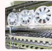
自浄機能付冷凍機

さらに、最新型の自浄洗浄機能付きフリーザーの採用や、製造工程の見直しなど、ハード・ソフト両面から対策を実施しています。