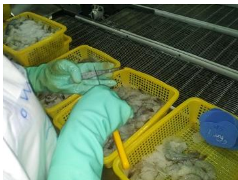
えびの加工作業の様子

社内外モニター調査 N=72、選択形式、複数回答可 実施日:2015年1月7日～16日