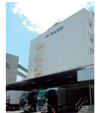
キョクヨー秋津冷蔵(株)城南島事業所

We provide a comprehensive range of logistics services, from warehousing through to delivery, with our cold storage business, which operates from three sites (in Ohi and Jonanjima in Tokyo, and in Fukuoka), playing a key role. Going forward, we will continue to pursue greater business scale and improved services.