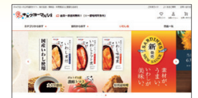
キョクヨーマルシェ TOPページ

The Kyokuyo Marché online store stocks Sea Marché brand products and other seafood products for use in home as well as health foods and gourmet products ideal for gift-giving.