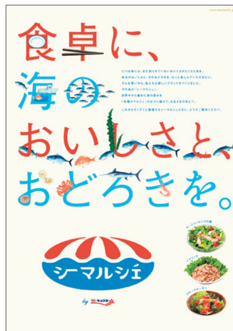
シーマルシェPRポスター

We proudly present the Sea Marché product brand. Through Sea Marché , we offer delicious, value-added products in which every stage from procurement through processing to sales embodies the high quality and innovation that only Kyokuyo can provide. In 2025, the new Kurayoshi Plant (in Tottori Prefecture), which will be producing Sea Marché brand frozen food products, began operation, and we are planning to further expand our branded products business.