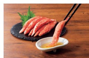
オーシャンキング