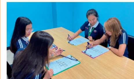
海外関係会社の業務風景

Through its overseas affiliates and representative offices, the Kyokuyo Group undertakes the exportation of marine products caught in Japan, and offshore trade, as well as developing global sales of raw materials and processed foods made from marine products, and frozen foods, through affiliate companies. We are also focusing on building new production locations and on strengthening sales in other countries where the market is growing, in line with our shift toward a business model that emphasizes "produce overseas, sell overseas."