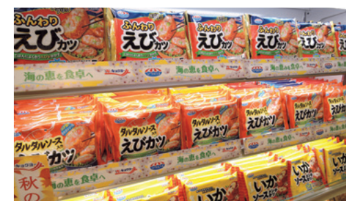
市販冷凍食品売り場イメージ

We are expanding sales of retail frozen food products, under the concept of “offering seafood side dishes that capitalize on our strengths.” Many people like and want to eat more seafood, but have difficulty finding the time to prepare seafood regularly. We are meeting consumers’ changing needs with products designed with the keywords of “easy, convenient and delicious.”