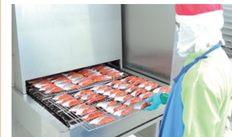
海外工場生産ライン