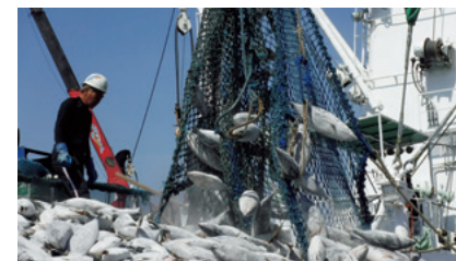
冷凍カツオの水揚げ

Led by the Wakaba Maru No. 11, Kyokuyo Suisan Co., Ltd. operates the Wakaba Maru purse seine fleet in the central and western Pacific Ocean, mainly catching high-quality skipjack. We continue to enhance operational efficiency and profitability, and strengthen our business while giving further consideration to the sustainability of marine resources, taking steps to address environmental issues such as the need to save energy.