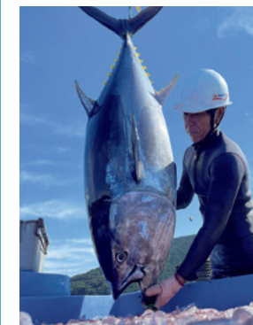
養殖マグロの取り上げ

In addition to helping to conserve the world's marine resources, we also operate an aquaculture business from the perspective of strengthening sustainability and access to resources. In the case of bluefin tuna, we supply products under our original brand, Hon-Maguro no Kiwami , using fish farmed with great care and attention amidst the rich natural environment of the southwest part of Shikoku Island in Japan. In addition, Kuroshio Suisan Co., Ltd., which is a Kyokuyo Group company, farms red sea bream, etc.