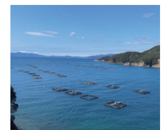
(株)クロシオ水産の養殖場