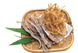
あたりめ、さざいか