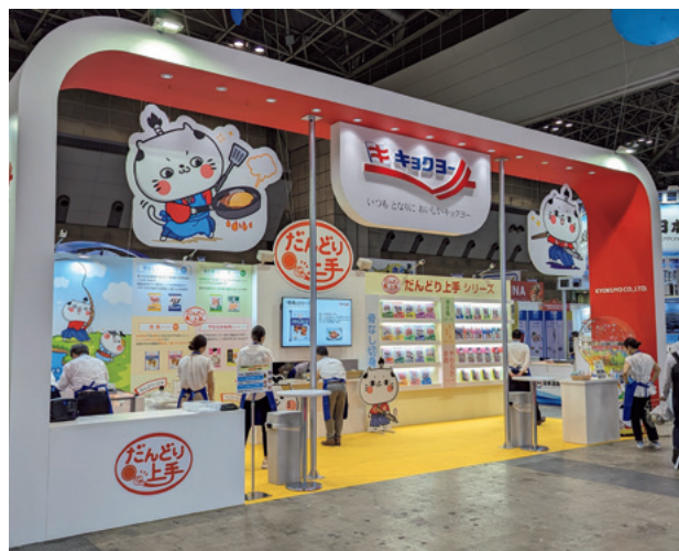
展示商談会への出展