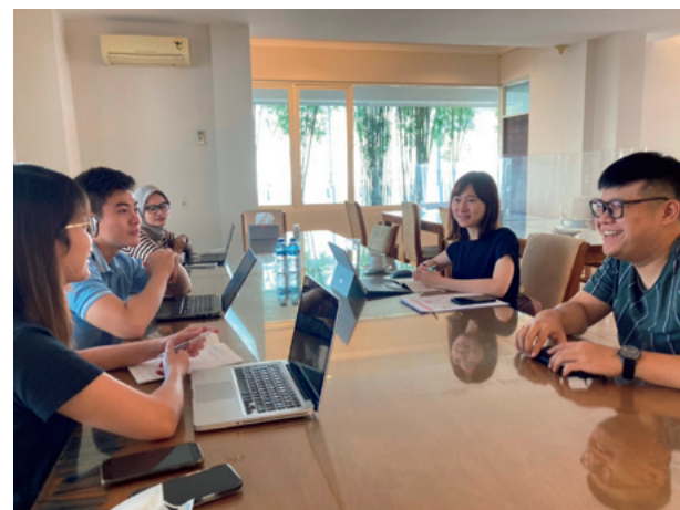
海外におけるエビの買い付け・商談

As seafood dishes have become popular and accessible around the world, the international competition to procure marine products is becoming more intense. We acquire only the highest-quality marine products from the oceans around the world through coordinated efforts among our headquarters, branch offices, representatives and affiliates inside and outside Japan, and via the global network that we have built up over the years based on relationships of trust with marine product companies.