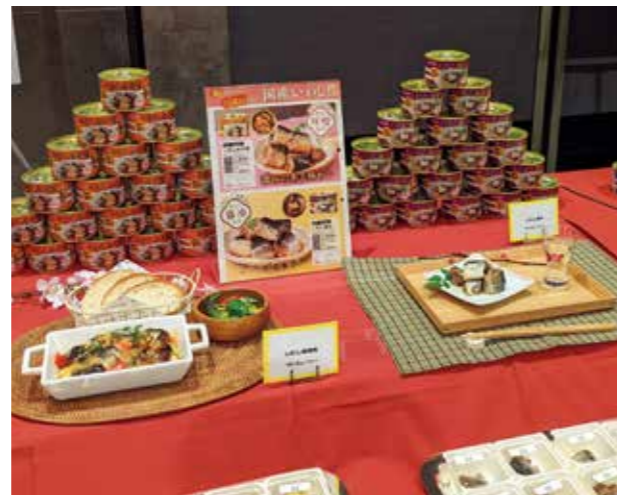
メディア向け新商品発表会