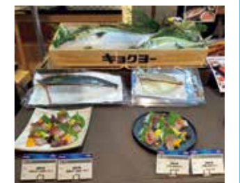
(株)クロシオ水産の養殖魚