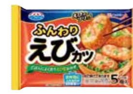
ふんわりえびカツR2