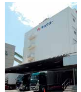
キョクヨー秋津冷蔵(株)城南島事業所

We provide a comprehensive range of logistics services, from warehousing through to delivery, with our cold storage business, which operates from three sites (in Ohi and Jonanjima in Tokyo, and in Fukuoka), playing a key role. Going forward, we will continue to pursue greater business scale and improved services.