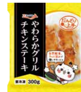
やわらかグリルチキンステーキ