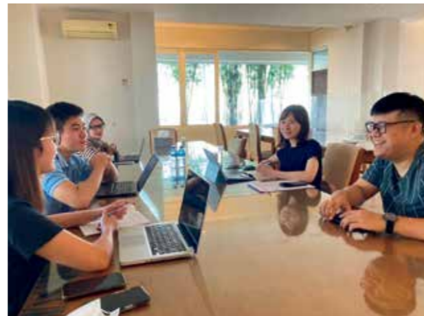
海外におけるエビの買い付け・商談

As seafood dishes have become popular and accessible around the world, the international competition to procure marine products is becoming more intense. We acquire only the highest-quality marine products from the oceans around the world through coordinated efforts among our headquarters, branch offices, representatives and affiliates inside and outside Japan, and via the global network that we have built up over the years based on relationships of trust with marine product companies.