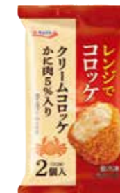
クリームコロッケ (かに肉入り)