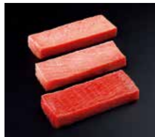
養殖マグロの加工品