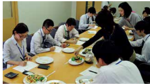
商品を使用したメニューの提案

We are strengthening our products to provide a high level of value-added that meets society's needs in terms of delicious flavor, time-saving value, and health value. We pursue product development with a consumer-led focus. Twice a year, in spring and fall, we invite the media and our business partners to new product announcements ahead of business talks about the products.