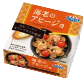
海老のアヒージョ