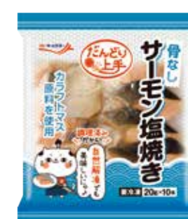
サーモン塩焼き(骨なし)