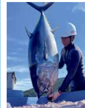
養殖マグロの取り上げ

In addition to helping to conserve the world's limited marine resources, we also operate an aquaculture business from the perspective of strengthening sustainability and access to resources. In the case of bluefin tuna, our Hon-Maguro no Kiwami fish farm, which we established and developed with careful attention to the rich natural environment of southwest Shikoku Island in Japan, has received high prize from customers. In 2017, we began shipment of fish produced by full-life-cycle aquaculture. Kuroshio Suisan Co., Ltd. which is a Kyokuyo Group company farms red sea bream and yellowtail, etc.