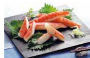
オーシャンキングの極