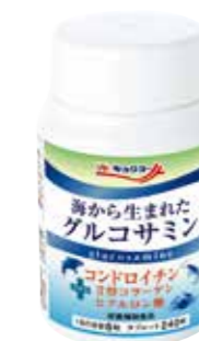
海から生まれた グルコサミン