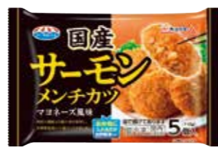
国産サーモンメンチカツ