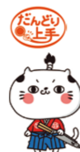
製品キャラクター「だんどり〜にゃ」

In 2023, which marked the 10th anniversary of the launching of the Dandori Jozu series we added meat products to the range for the first time. Processed to have a soft texture, these products still retain the original meat flavor and natural taste.