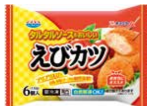
タルタルソースもおいしいえびカツ