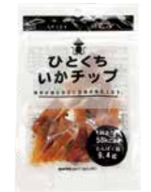
ひとくちいかチップ