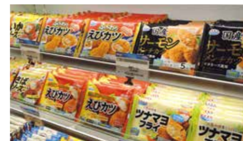
市販冷凍食品売り場イメージ

We are expanding sales of retail frozen food products, under the concept of “offering seafood side dishes that capitalize on our strengths.” Many people like and want to eat more seafood, but have difficulty finding the time to prepare seafood regularly. We are meeting consumers’ changing needs with products designed with the keywords of “easy, convenient and delicious.”