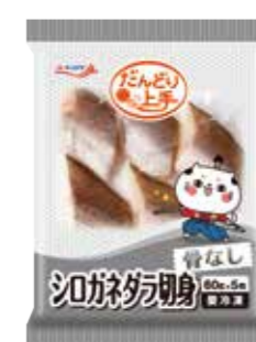
シロガネダラ切身(骨なし)