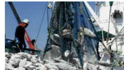
冷凍カツオの水揚げ

With the Wakaba Maru No. 11, which began operation in August 2022, we are aiming to enhance operational efficiency and profitability, and strengthening our business while giving further consideration to the sustainability of marine resources and taking steps to address environmental issues such as the need to save energy.