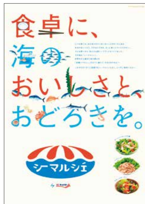
シーマルシェPRポスター

We proudly present the Sea Marché product brand. Through Sea Marché, we offer delicious, value-added products in which every stage from procurement through processing to sales embodies the high quality and innovation that only Kyokuyo can provide. As an ultra-professional company that has for many years now continued to link the world's fishing grounds to people's dining tables, in the future Kyokuyo will continue to use the know-how that we have built up over the years to provide delicious surprises for consumers' dining tables.