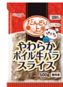
やわらかポイル牛バラスライス