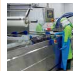
海外工場での作業風景