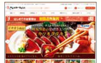
キョクヨーマルシェ TOPページ

The Kyokuyo Marché online store stocks Sea Marché brand products and other seafood products for use in home as well as health foods and gourmet products ideal for gift-giving.