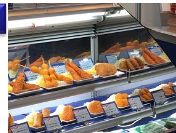
惣菜売り場イメージ

単身世帯、共働き世帯の増加などから、中食市場規模は拡大しています。当社では従来、外食店舗や量販店惣菜売り場向け商品として、業務用冷凍食品を販売してきましたが、今回、その中でも特にニーズの高い「真いかから揚げ」や「白身魚フライ」、「えびフライ」をリニューアルし、商品力の強化を図りました。